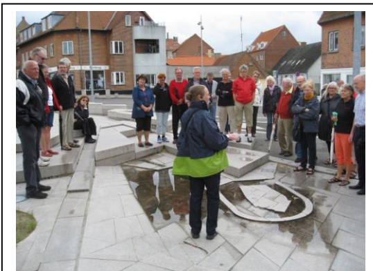
Byvandring i Nykøbing F.