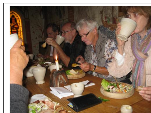
Middelaldermad i restauranten