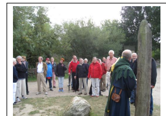
Rundvisning i Middelaldercenteret